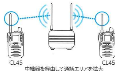
CL45 中継器を経由して通話エリアを拡大 CL45

※選択呼び出し、オートチャンネルセレクト等、一部中継装置を介した通話に対応しない機能があります。