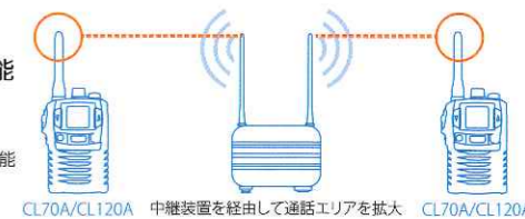
CL70A/CL120A 中継装置を経由して通話エリアを拡大 CL70A/CL120A

送信出力切り替え機能 (10mW/1mW) 1mW時中継用Ch (12~29ch)で連続通話が可能