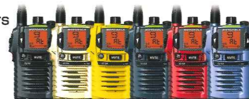
ブラック シルバー イエロー ネイビー レッド ブルー